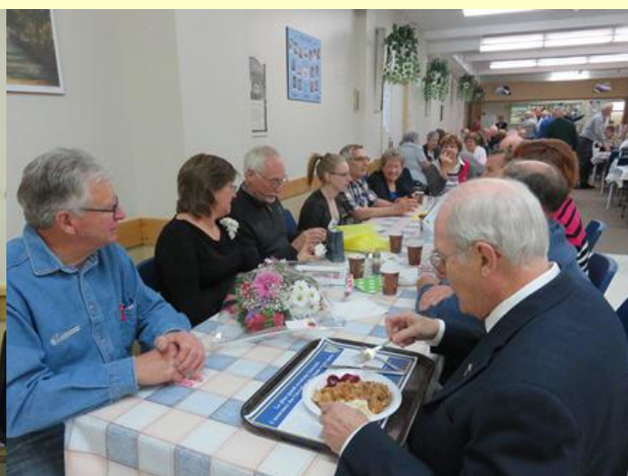
Une très belle participation pour le brunch.