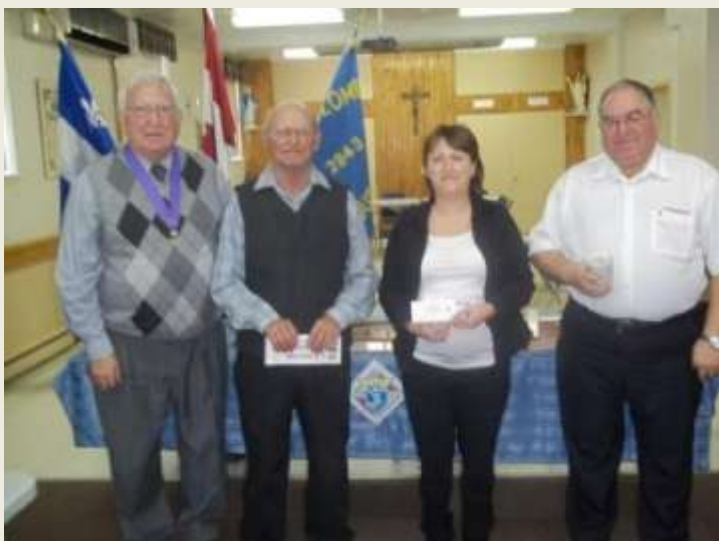
Les gagnants des prix de présences et prix de partages lors de l'assemblée du 17 novembre.