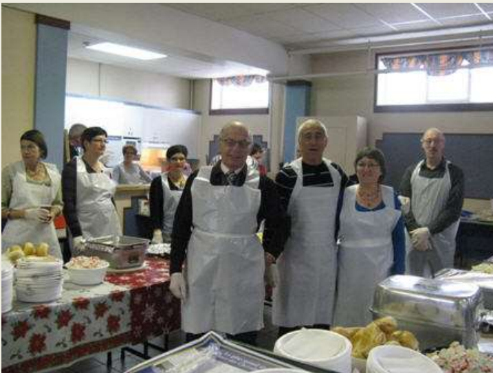
Les bénévoles qui nous ont servi ce très bon dîner.