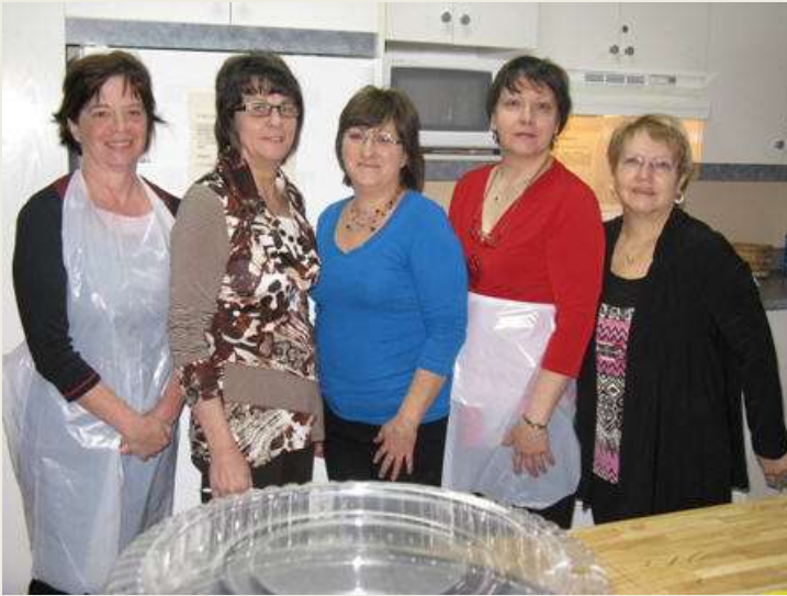
Une partie des cuisinières du brunch du Partage. Vous êtes merveilleuses mesdames.