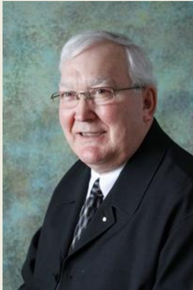
Gracieuseté de Blondin Lagacé