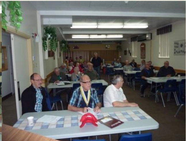
Une partie de l'assemblée présente lors de la rencontre du 22 septembre dernier.