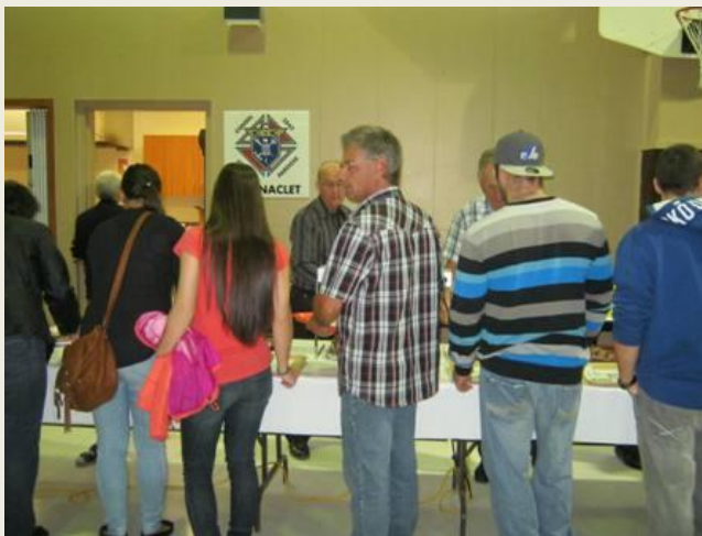
Les chevaliers de St-Anaclet remercient tous ceux et celles qui ont participé à leur déjeuner tenu le 22 septembre dernier.