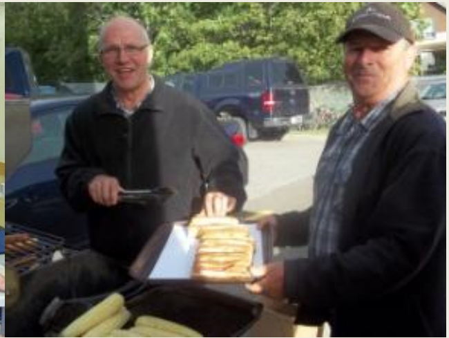
Deux vaillants chevaliers parmi plusieurs autres ont travaillé à préparer des blés d'Inde et Hot-dogs lors de la soirée de lancement des activités le 5 septembre dernier.