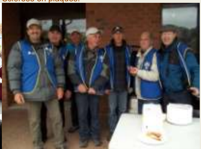
Une belle équipe de chevaliers vaillants. Le CA de la SP, section Bas St-Laurent vous remercie énormément de votre implication.