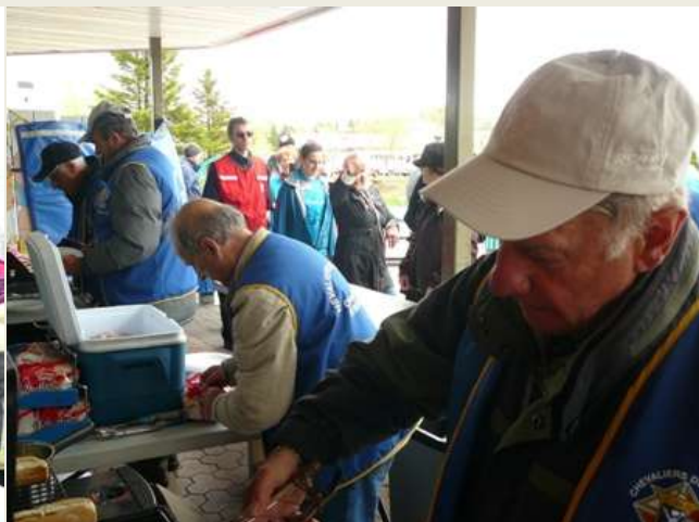
Des frères chevaliers à l'oeuvre lors de la marche pour la Sclérose en plaques. Les hot-dogs ils connaissent ça. Après leur implication à la marche pour la maison de fin de vie, ils s'impliquent pour la Sclérose en plaques.