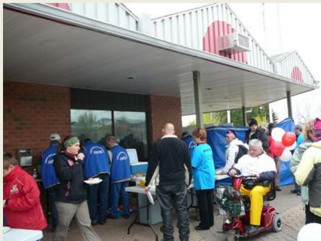
Après une marche dans une température de novembre de bons hot-dogs ça fait du bien.