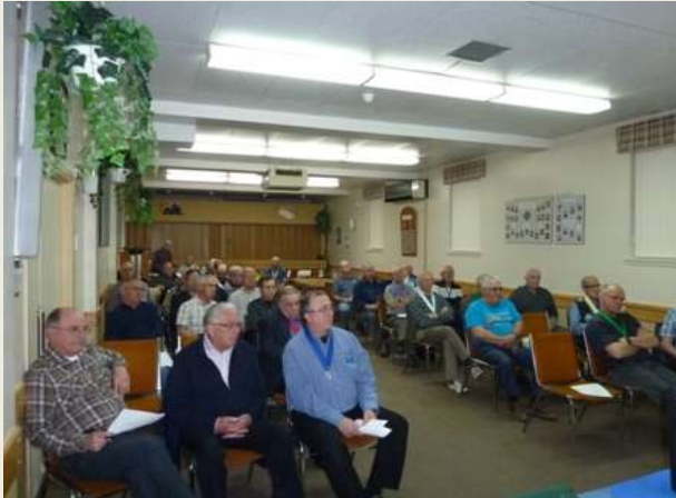
Une belle participation lors de notre assemblée générale du 16 mai dernier.