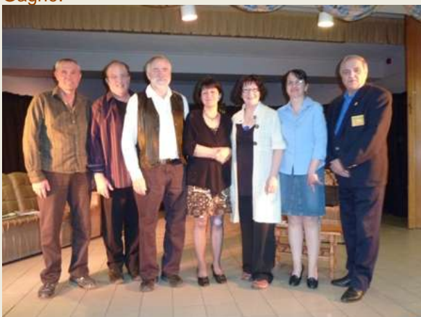
Voici l'équipe d'Esprit-Saint qui a joué la pièce de théâtre au sous-sol de l'église Ste-Agnès au profit de l'arrimage.