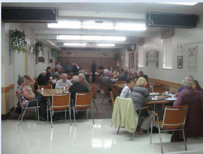
Une vue de la belle assemblée mensuelle lors du déjeuner rencontré tenu le 16 septembre.